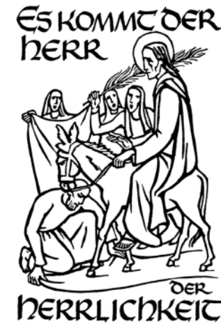
Evangelium am 1. Advent: Matthäus 21,1-9

Wir begrüßen den König der Ehren und bereiten ihm den Weg. Wir improvisieren dabei; wir gebrauchen das, was wir haben. Wir besitzen keinen teuren roten Teppich, aber wir opfern unser letztes Hemd, um es vor seinen Füßen auszubreiten. Dazu müssen wir uns vor ihm bücken und auf die Knie gehen. Wir besitzen keine stolzen Fahnen, um ihm zuzuwinken, aber wir grüßen ihn mit dem, was wir gerade finden: Ein paar Zweige von den Straßenbäumen und ungeschulte, teilweise brüchige Stimmen. Wir vertrauen darauf: Dieser Herr der Herrlichkeit lässt sich unser wenig herrliches Lob gern gefallen. Matthias Krieser